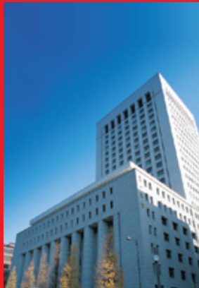
Tòa nhà trụ sở Dai-ichi Life Holdings tại Tokyo, Nhật Bản